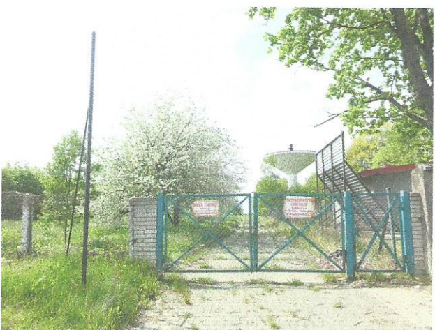
Bielsk Podlaski ul. Białostocka, maj 2014 r.